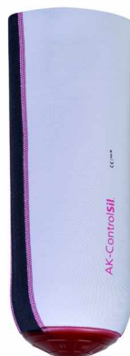
大腿抗旋假肢硅胶套