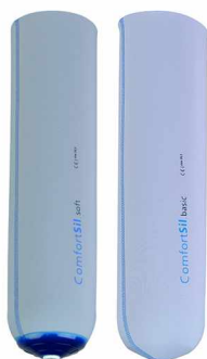
舒适型小腿假肢硅胶套