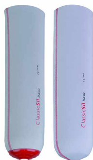
经典型小腿假肢硅胶套