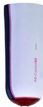
大腿抗旋增强型假肢硅胶套